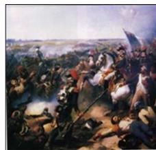
1794-1796 132 e demi-brigade de bataille FLEURUS