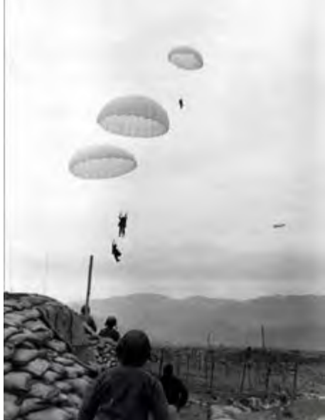
Parachutage des hommes de l'Antenne Chirurgicale Parachutiste n° 3 sur la zone des PC le 13 mars 1954.

Réunion des commandants des unités parachutistes de DBP, le 27 mars 1954, dans l'abri du lieutenant-colonel Langlais. De droite à gauche, le chef d'escadrons de Séguins-Pazzis adjoint du GAP, le lieutenant-colonel Langlais commandant le GAP, le capitaine Tourret commandant le 8 e BPC, le chef de bataillon Bigeard commandant le 6 e BPC et le capitaine Botella commandant le 5 e BPVN.