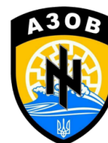
Insigne du Bataillon AZOV

La milice nationaliste PATRIOT UKRAÏNI est issue du parti SVOBODA. Ses cadres ont fourni l'ossature des cadres du bataillon AZOV.