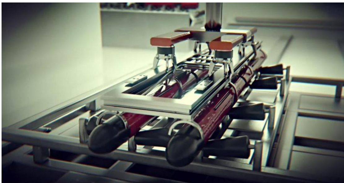
Missiles Flexis sur chaîne d'assemblage

Cette fois, une équipe projet de 9 collaborateurs travaillant en France, en Allemagne, au Royaume-Uni, en Italie et en Espagne a analysé une centaine de réponses provenant des équipes de MBDA. Ils en ont ensuite fait la synthèse pour développer un concept destiné à accroître considérablement l'adaptabilité des armes, élargir l'éventail des effets à produire et d'augmenter l'autonomie d'une force projetée, tout en réduisant substantiellement le fardeau logistique pour le commandement.