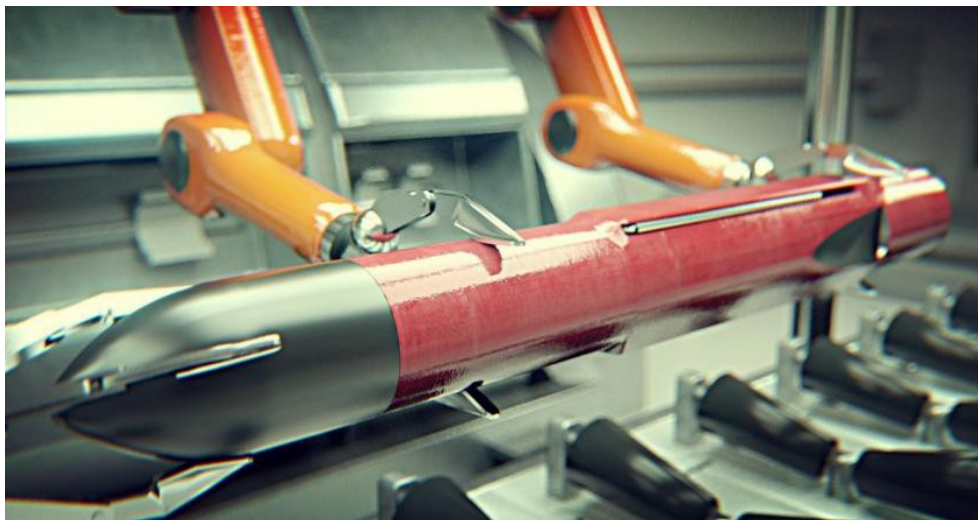
Le Flexis sur sa chaîne de montage