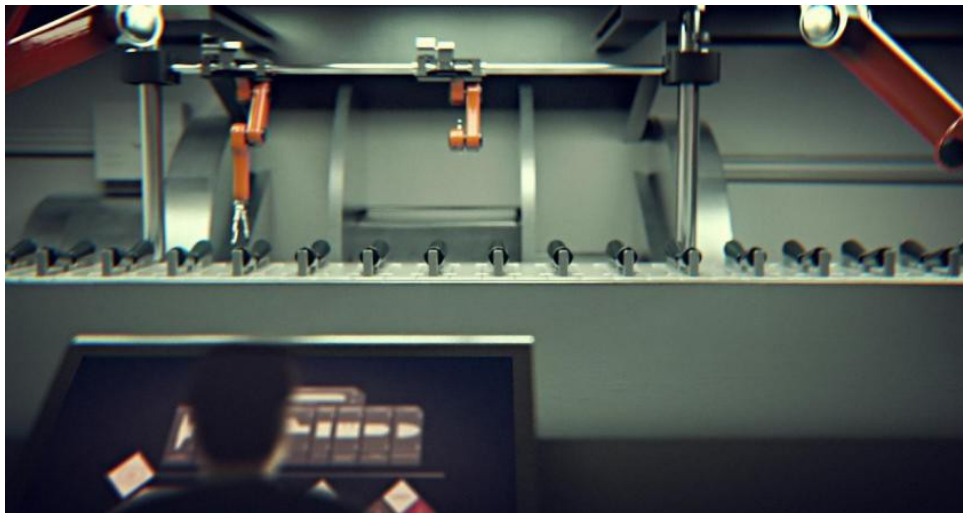
Chaîne de montage automatisée

Pour présenter son concept, MBDA s'est appuyé sur le cas des avions de combat mis en œuvre par un porte-avions. « C'est un bon exemple de la problématique qui se posait à nous. Le groupe aérien embarqué peut en effet avoir à faire face sans délai à des conflits qui émergent et devoir produire les effets souhaités avec les seuls missiles disponibles à bord. La difficulté ici consiste à pouvoir disposer des armements nécessaires pour traiter des scénarios toujours plus diversifiés, avec la contrainte d'une soute à armement à bord du porte-avions qui, elle, ne pourra pas grandir », explique Edward Dodwell, leader de l'équipe Concept Visions 2015 de MBDA. Pour l'industriel, la réponse à cette problématique, c'est donc la modularité appliquée non seulement aux missiles sortant de chaîne, mais aussi jusqu'au moment où l'on charge ceux-ci sur l'aéronef avant son départ en mission. Cette modularité doit être à la fois simple et robuste, pour permettre à l'opérateur de configurer lui-même le missile au dernier moment. Concrètement, le porte-avions serait équipé d'un stock de bus communs et de sous-équipements, un banc d'assemblage automatisé aidant les techniciens d'armes à monter puis certifier les missiles avant le vol.