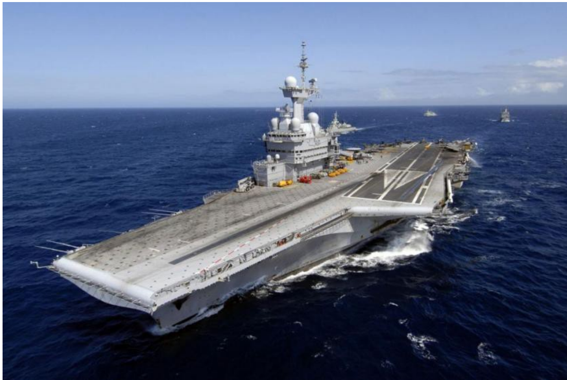
Le Charles de Gaulle

Permettant de faciliter la gestion des stocks, le CVW 102 Flexis a donc été pensé pour répondre à un besoin opérationnel visant une grande flexibilité et une adaptabilité des missiles, l'assemblage des modules pouvant intervenir dans un délai très court avant la mission. Ce qui procure aussi une grande adaptabilité des capacités de frappe d'une force projetée sur une zone très instable ou un théâtre d'opération marqué par des menaces diverses.