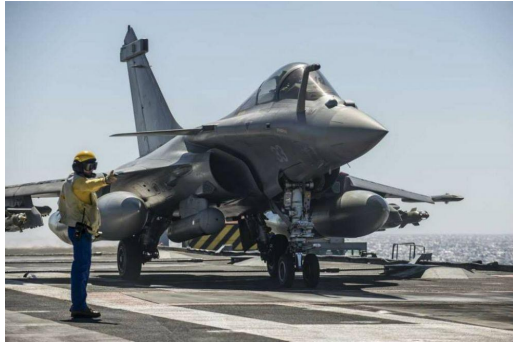
Rafale Marine sur le porte-avions Charles de Gaulle