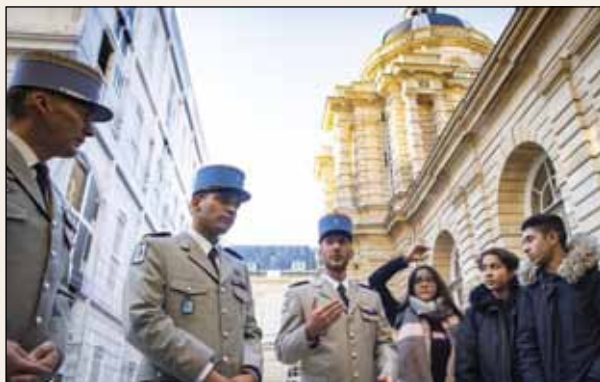
Classe de Défense

mettre en œuvre les acquis de leur formation et de favoriser leur insertion socioprofessionnelle grâce à une expérience valorisante. Pour la plupart des étudiants, les stages conventionnés font partie intégrante de leur cursus universitaire car ces expériences professionnelles immersives sont prises