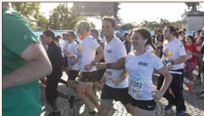
Participation aux 20 km de Paris

Les Cordées de la réussite, consistent pour les élèves d'une grande école de la Défense à parrainer des lycéens méritants dont les capacités et le mérite sont reconnus mais dont le contexte familial et social peut brider l'ambition pour les accompagner dans leur projet d'intégration dans l'enseignement supérieur.