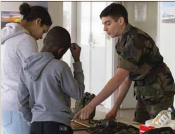
Stage de 3 e à l'hôpital d'Instruction des Armées de Percy

Cette sensibilisation au lien armées-jeunesse-citoyenneté permet aux élèves d'acquérir de manière ludique des connaissances, des compétences et la culture nécessaires en matière de défense et de sécurité nationale à travers l'histoire, les enjeux de société et le patrimoine.