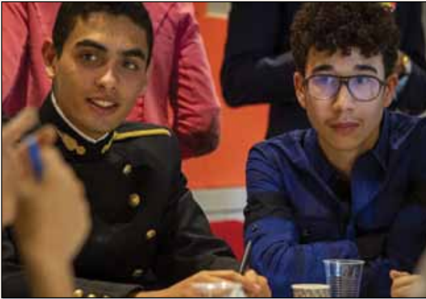
Cordée de la réussite entre un polytechnicien et un jeune

Les élèves de ces établissements sont admis au titre de l'aide à la famille (ayant-droit) et de l'aide au recrutement (BTS, classes préparatoires aux concours des grandes écoles de la Défense). Par ailleurs, 15 % des places en lycée sont réservées à des élèves boursiers. Ces lycées proposent des classes préparatoires à l'enseignement supérieur. Ces classes sont acces-