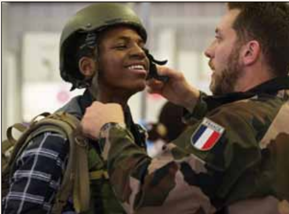
Présentation du métier d'opérateur de prise de vue en opération

Il existe 33 centres cadets, en partenariat avec 229 établissements scolaires, impliquant 1 000 élèves dont 23 % en éducation prioritaire. Sur les 33 centres cadets, 17 sont rattachés à l'armée de Terre, 4 à la Marine nationale, 5 à l'armée de l'Air et de l'Espace