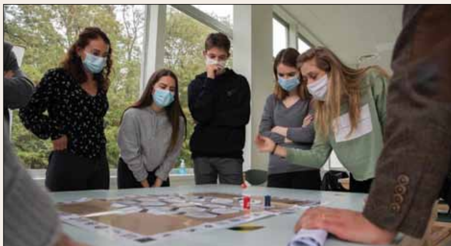
Service civique au ministère des Armées

Le stage de 3 e armée de l'Air permet, durant 4 jours, à des groupes de 25 élèves scolarisés en réseau d'éducation prioritaire de décou-