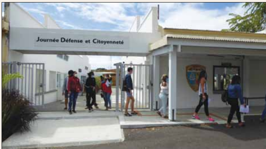
Journée Défense et Citoyenneté à Mayotte