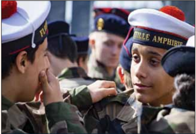
Cadets de la Défense

Les classes de défense offrent des temps de rencontres et d'activités avec des militaires pour donner aux élèves des repères pour comprendre la défense et la sécurité nationale, à travers ses acteurs et ses enjeux, son histoire, sa mémoire et son patrimoine. Les classes de défense sont l'un des dispositifs majeurs du plan « égalité des chances » du ministère des Armées. Elles participent au lien armées – jeunesse. Il existe actuellement plus de 475 classes de défense réparties sur l'ensemble du territoire, impliquant plus de 11 875 élèves et plus de 200 entités des Armées, directions et services.