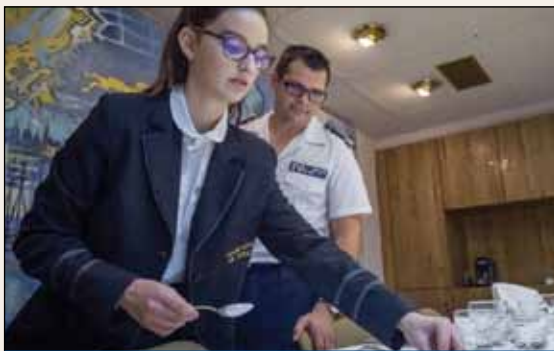
Partenariat d'apprentissage entre la Marine et un lycée hôtelier