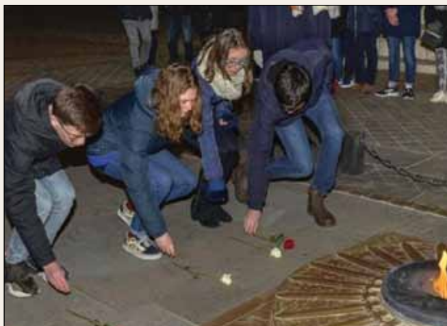
Jeunes à l'Arc de Triomphe

en compte pour la validation de leur diplôme. Sous certaines conditions, et à partir de 44 jours ou 308 heures de présence effective, une gratification de