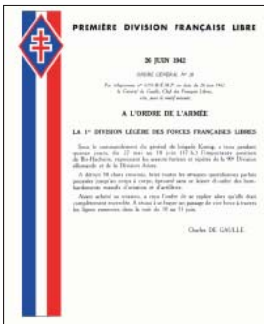
Citation de la 1 re DFL à l'ordre de l'armée, 26 juin 1942.

Ministère de la défense Secrétariat général pour l'administration Direction de la mémoire, du patrimoine et des archives 14, rue Saint-Dominique 00450 ARMÉES