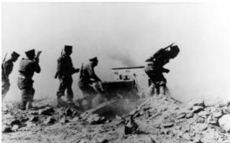
Le 1 er régiment d'artillerie FFL à Bir Hakeim.